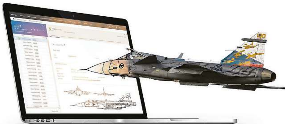
MC CATALOGUE JE VLAJKOVOU EXPORTNÍ LODÍ AURY

Úspěch naší obchodní politiky se opírá nejen o kvalitu samotných softwarových produktů, které tvoříme a dodáváme, ale i o komplexní podporu, kterou poskytujeme zákazníkům a i samotným uživatelům. Školení, semináře, brněnské mezinárodní kodifikační kurzy, známé jako NCS College, a smysluplná spolupráce například s Univerzitou obrany a Národním kodifikačním úřadem Česka přispěly ke vzdělání stovek odborníků z desítek zemí na pěti kontinentech. I díky tomu je naše firemní know-how ceněno po celém světě, což potvrzují i ekonomické přínosy plynoucí z exportu těchto technologií.